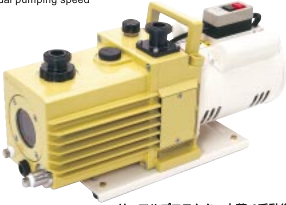
サーマルプロテクター内蔵 (手動復帰) With built-in thermal protector