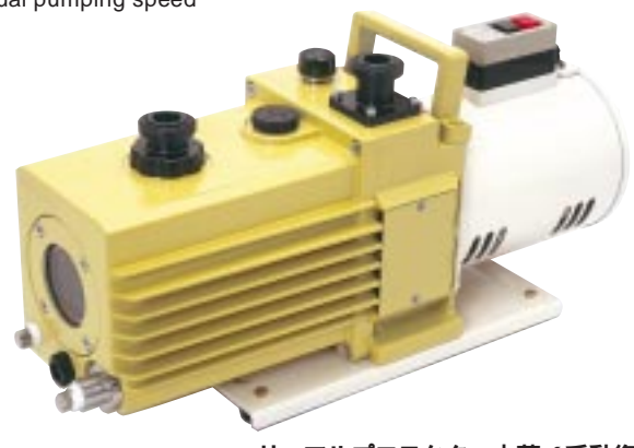
サーマルプロテクター内蔵 (手動復帰) With built-in thermal protector